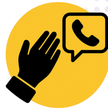
Figura de acompañamiento

Persona o medio que recibe por primera vez la queja o solicitud de apoyo.